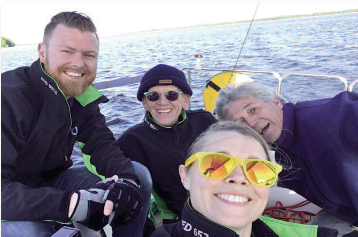
Top avonden wedstrijdzeilen.

Mijn eigen watersport belevenis is op dit moment wat minder, TW drijft en daar is alles mee gezegd. Doordat het mij te koud is en ik nogal druk was met de verhuizing is TW een beetje erbij in geschoten. Ik ben sinds 1 januari voor mijzelf begonnen als filmmaker en Sign en mijn eigen toko vraagt ook tijd en aandacht (zeg maar werk). Wij varen de WAC en doen het goed, om de week hebben wij een stuurvrouw en bijna alle meiden en jongens zijn er weer. Behalve Machteld, zij is bevallen, een tweede zoon, met Maurits als naam. Vader en Maurits maken het goed en doen een tukje van