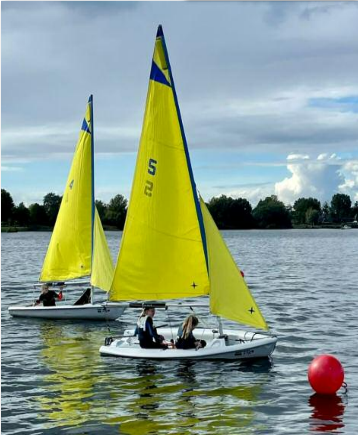
De Pico's onder zeil, gezellig met zijn twee.