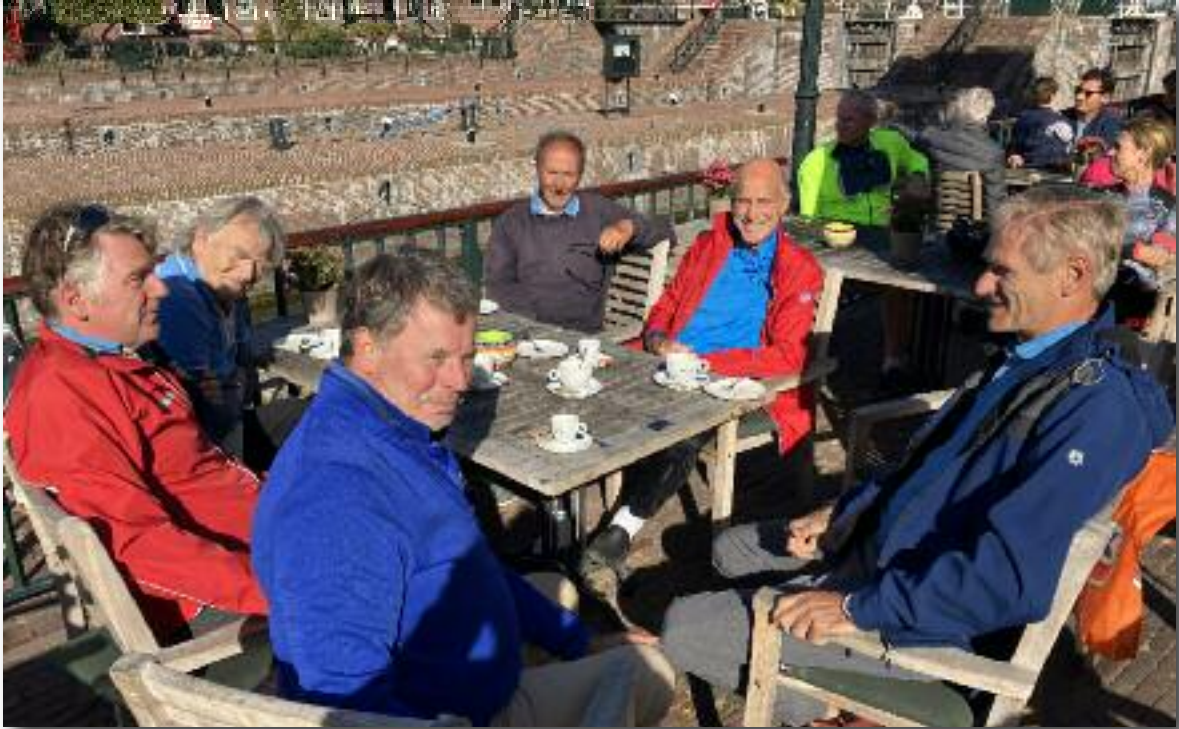
Bij Ome Ko.

zoals gebruikelijk afgesloten met een borrel en BBQ bij Isala.