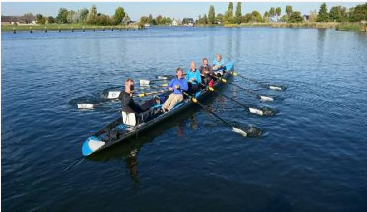
Op de IJssel. (RIJM)

In juni namen we met een team deel aan de Rijn-Ijssel Maraton (RIJM), georganiseerd door de Zutphense roeivereniging Isala. Een inspannende maar prachtige tocht van 76 km van Oosterbeek naar Zutphen over Rijn en Ijssel. Onze teamleden roeiden in estafette ieder gemiddeld de helft van deze afstand. De tocht werd