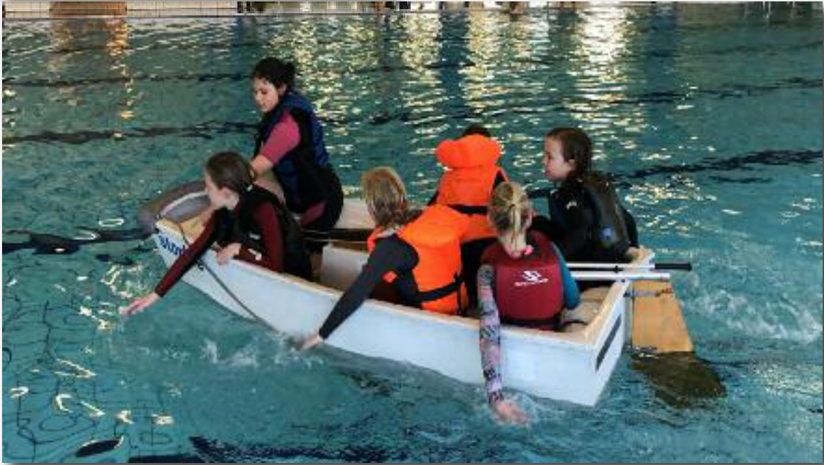
Zwembadtraining in het omslaan van een Optimist.

Onze wedstrijdgroep heeft alle combi wedstrijden dit jaar gevaren en kwamen regelmatig met prijzen thuis. Het was een mooi gezicht als ze met alle optimisten op onze nieuwe trailer betrokken en weer thuis kwamen.