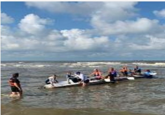
Coastel Rowing optima forma.

Op 10 september gingen we met 2 teams naar Katwijk voor deelname aan de Katwijk Coastal Rowing, een echte Zeeroei-wedstrijd op de Noordzee vanaf het strand bij Katwijk. Vanaf het strand vertrekken en daarnaar terugkomen door de Noordzee branding was voor de meesten