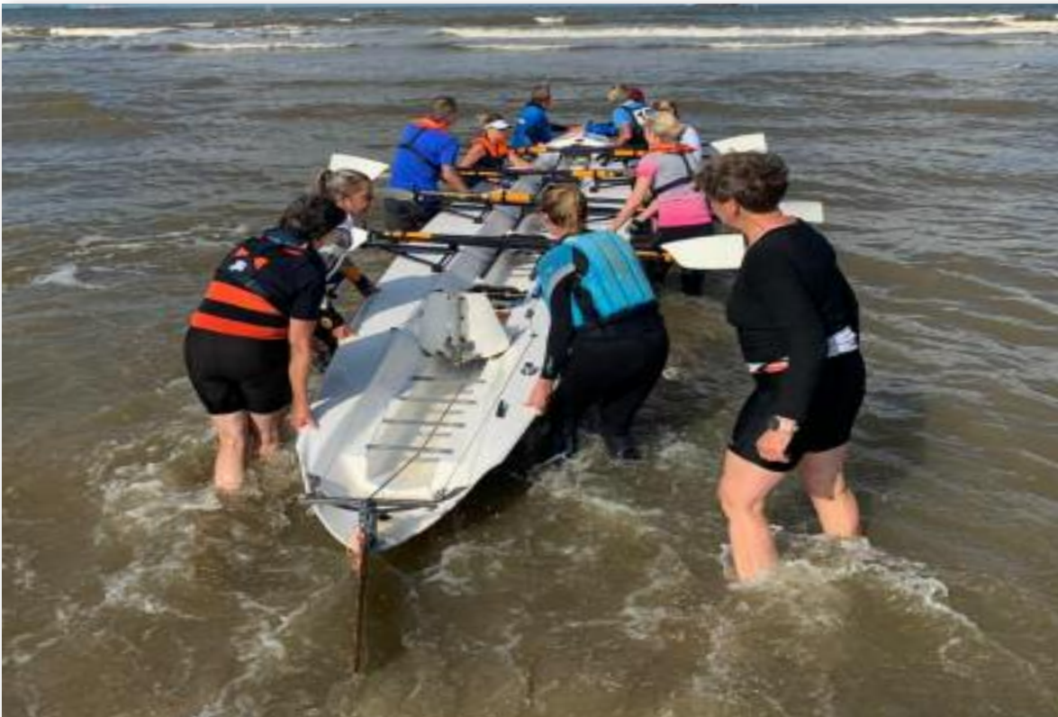
Even door de branding.

dergelijke events? Plan het tijdig in en meld je tijdig aan! Roei je nog niet maar wel geïnteresseerd in roeien of ken je iemand die dat is? Neem contact op met de Zeeroei-commissie!