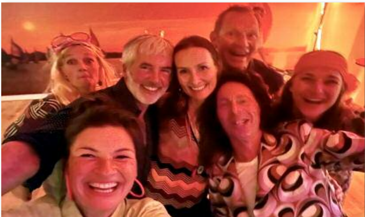
Wazig maar vermakelijk.