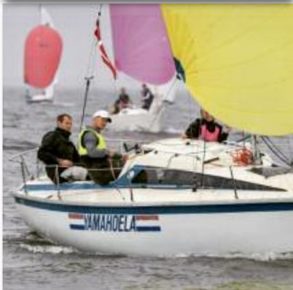
YamaHoela in vol ornaat.

water af na een tweetje in de laatste wedstrijd. Voor de start van de tweede wedstrijd helaas een aanvaring met her en der schade waarbij veel boten betrokken waren... Nooit leuk... Ondanks dat konden de deelnemers in de verte trouwens wel genieten van het spektakel van de Frostbite!