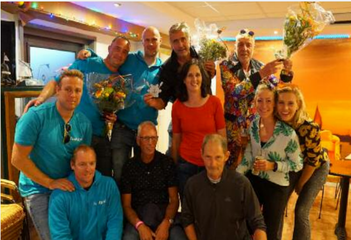
ORC-B Prijswinnaars 2022.