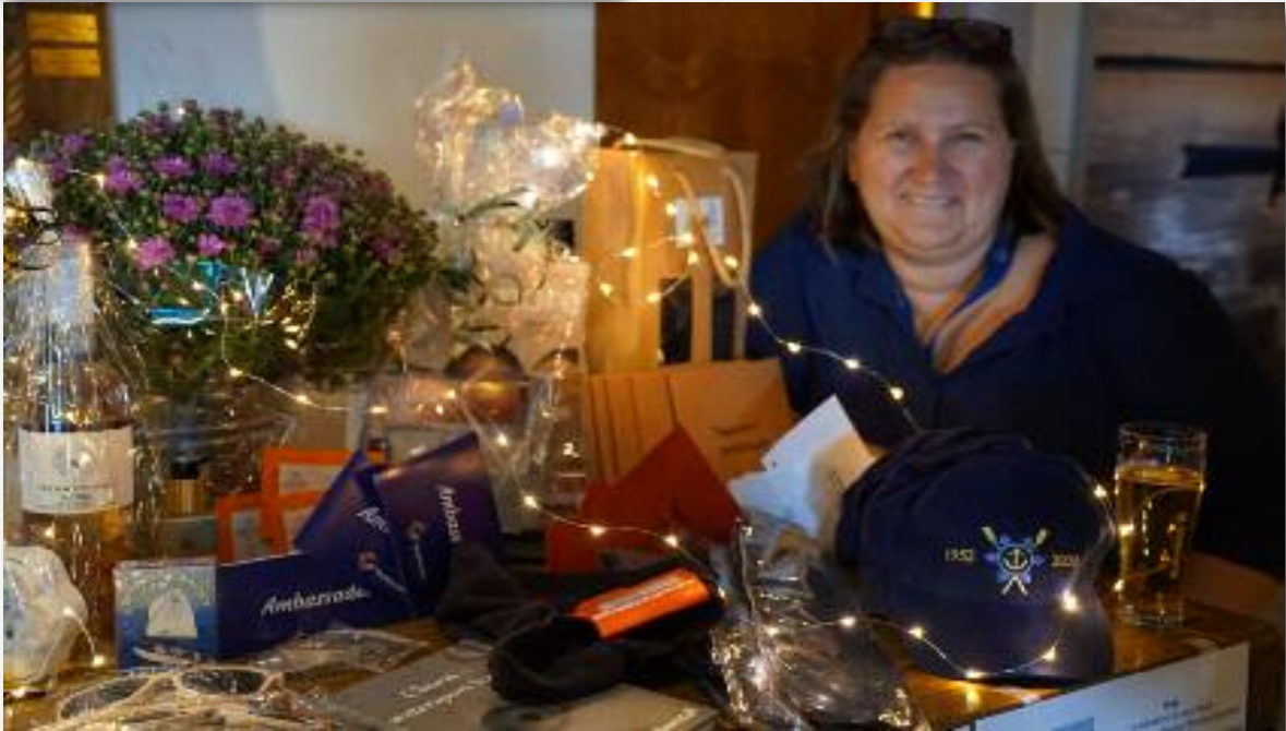
Fleur voor de velen prijzen, Grabbelton.

end een Volvo, een cabrio Fiat en een Toyota, maar ook waardebonnen van onze burens, Scheepsdief en Porterhouse. En nog veel meer, teveel om op te noemen. Bij dergelijke onderscheidingen horen natuurlijk ook bloemen en