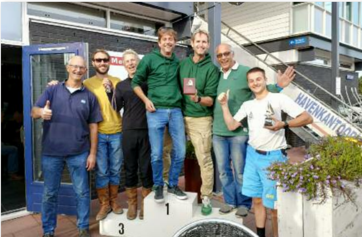
De R&ZV 'Naarden' bezet bijna heel het Podium in Almere-Haven.