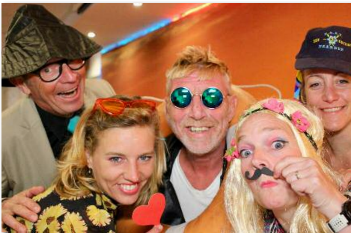
Van je familie moet je het hebben, de Ballentent en Lyra.