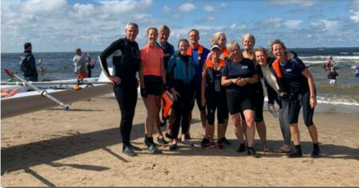
Deelnemende Teams op het warme zand van het strand bij Katwijk aan Zee.

Amsterdam Light Festival, georganiseerd door Toprow. Dit was in voorgaande jaren ook altijd een bijzondere ervaring!