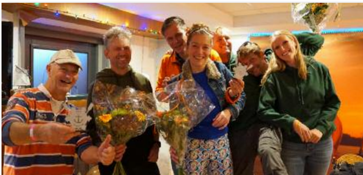
ORC-A Prijswinnaars 2022.

den we maar 1 wedstrijd varen. Deze wedstrijd werd in bijna alle klassen gewonnen door de uiteindelijke winnaars van het seizoen. Alleen in de ORC-B wist de Lyra de dagwinst weg te kapen van de winnaars van het seizoen. Juul,