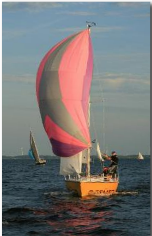
De Comodo met spi, zo 2022.