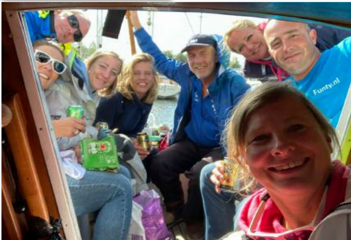
ORC-B na de Wedstrijd. Met Spa geel.

tweeëneuhalf uur lang mogen genieten van het Gooimeer in al haar windstille glorie. 2 weken later was de finale. Een finale die zou bestaan uit 2 wedstrijden. Helaas liet het weer wederom te wensen over en kon-