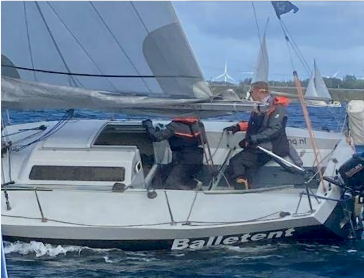
ORC-A de Balletent, ook een eetgelegenheid in Rotterdam, met de lekkerste ballen. Ja' gehakt dan.

binnen voor de 'echte' storm. De boten die nog buiten waren leerden wat een 'stevig windje' op het Gooimeer kan doen. Vlagen die de boten op een oor legden en striemende regen die je het zicht ontnemt. Gelukkig is iedereen ongedeerd weer aan wal gekomen. In het clubhuis werd, zoals gewoonlijk, een biertje gedronken op de goede afloop. Maar ook weinig wind kwam dit jaar voor, of zeg maar gerust geen wind! Op 7 september voeren we de kortste baan van het seizoen.