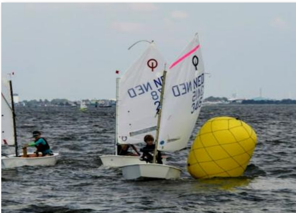
De Optimisten in de wedstrijd.

Optimistzeilers leren zo vertrouwd te raken met wetsuit en zwemvest in het water. En ze leren, vaak voor het eerst, hoe een bootje reageert als je stuurt, of zonder zwaard. Ook leren ze vast hun groepje en trainers kennen. En het hoogtepunt van de dag is natuurlijk dat ze gecontroleerd omslaan, onder het bootje door