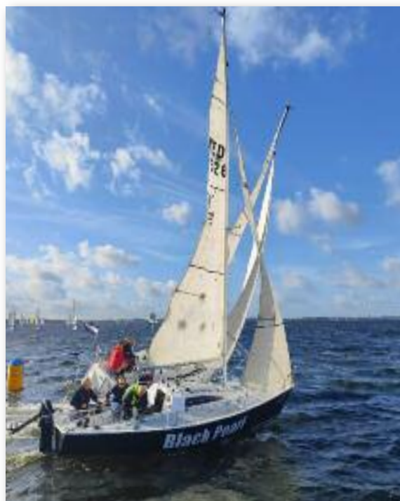
Black Pearl 3de plaats

Bij de prijsuitreiking in het pittoreske Anton Pieck achtige Almere mocht de YAMAHOELA de hoofdprijs in de SW Hoog ophalen. De SECOND WAVE eindigde als tweede en de BLACK PEARL als derde. Drie ¼ tonners op het podium, toch leuk! Voor de YAMAHOELA was het helemaal een feestdag! Omdat we de