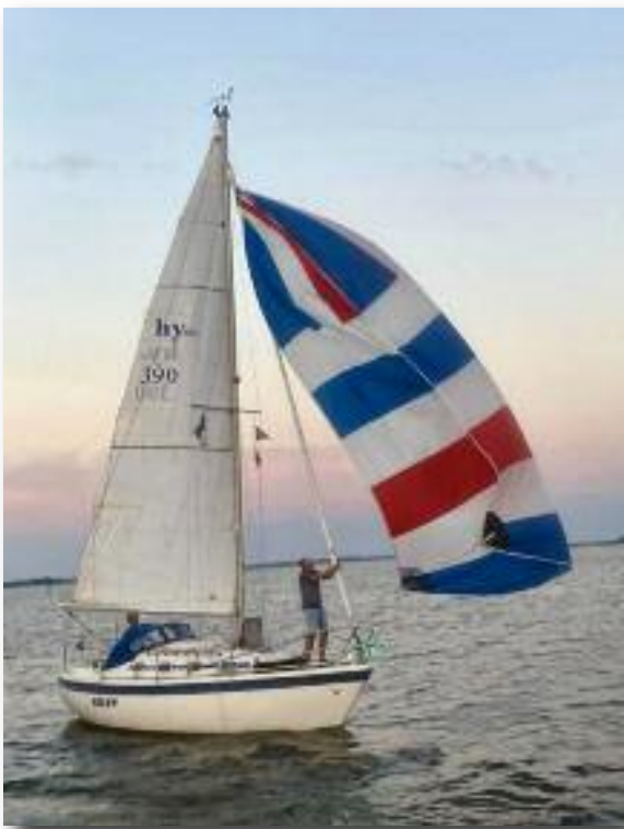
De Meeuw met spi.