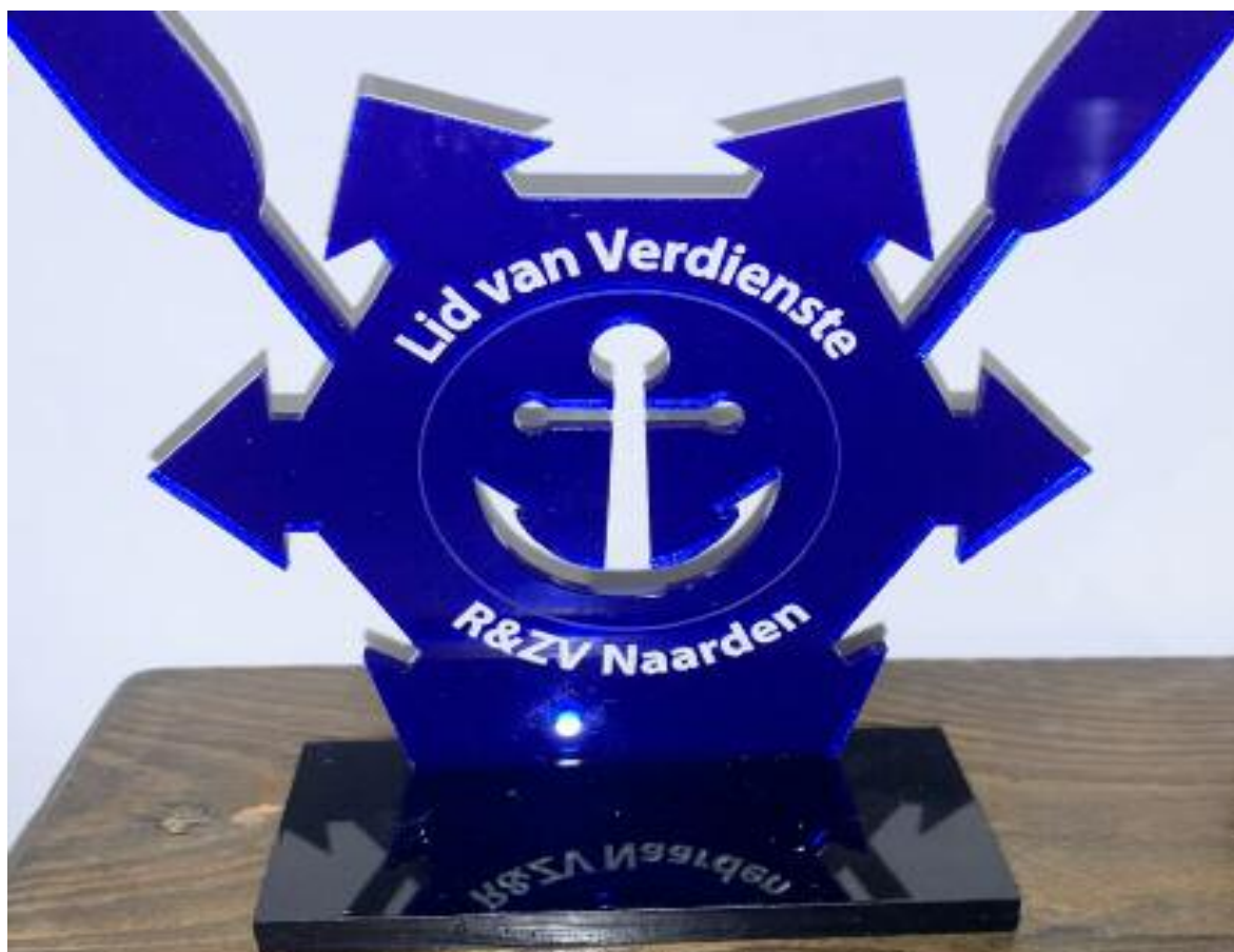
De onderscheiding voor op de schoorsteenmantel.

ben gedaan en nog steeds veel doen voor de club. Het bestuur heeft hiertoe nieuwe onderscheidingen laten maken voor leden van verdienste. En zo'n onderscheiding krijg je niet zomaar. Het is wel een EER.