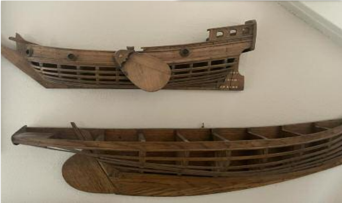
De scheepsmodellen van Martens.

krijgen in de functionaliteit. Voor vrachtvervoer zocht men naar de optimale mix van snelheid, ruim-grootte en schoonheid. Dat kon ook omdat de spanten goed zichtbaar waren waardoor je het goed kunt berekenen. Voor de bouw van oorlogsschepen dienden de modellen, naast de optimaal hiervoor genoemde mix, ook om bijvoorbeeld met de admiraliteit de stand van de kanonnen te bepalen. Het voordeel van modellen was dat men, na de bouw (die vaak toch weer anders uitpakte), studiemateriaal had, en zodoende de scheepsbouw verder kon ontwikkelen. Later werden er ook modellen van de windjammers door de matrozen gemaakt