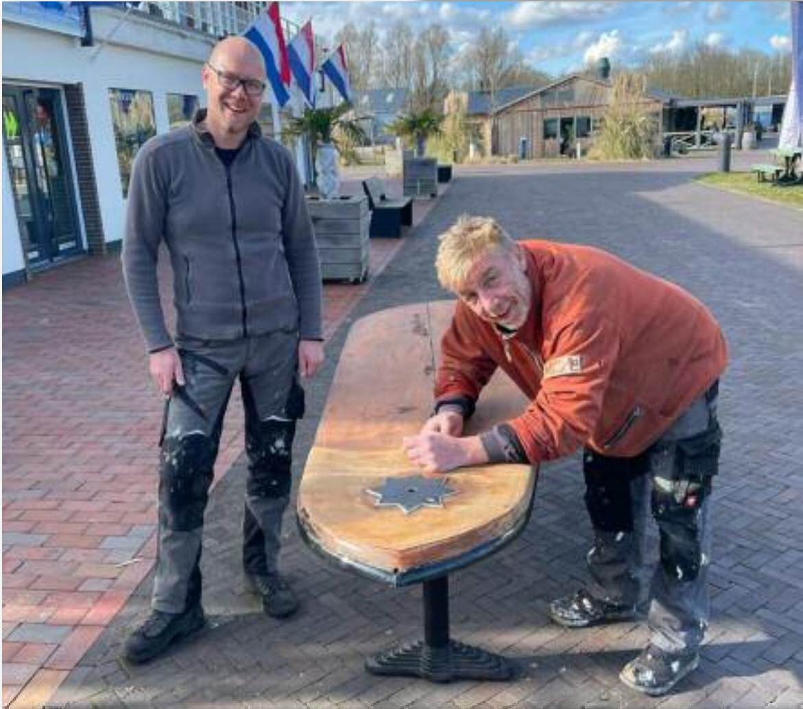
De zwaardtafel, in ere hersteld.

Hooikistrace staan en hopelijk gaat die ook dit jaar weer nieuwe leden opleveren. We gaan er in ieder geval een feestje van maken. Het seizoen eindigt met de Grande Finale op Zaterdag 16 september.