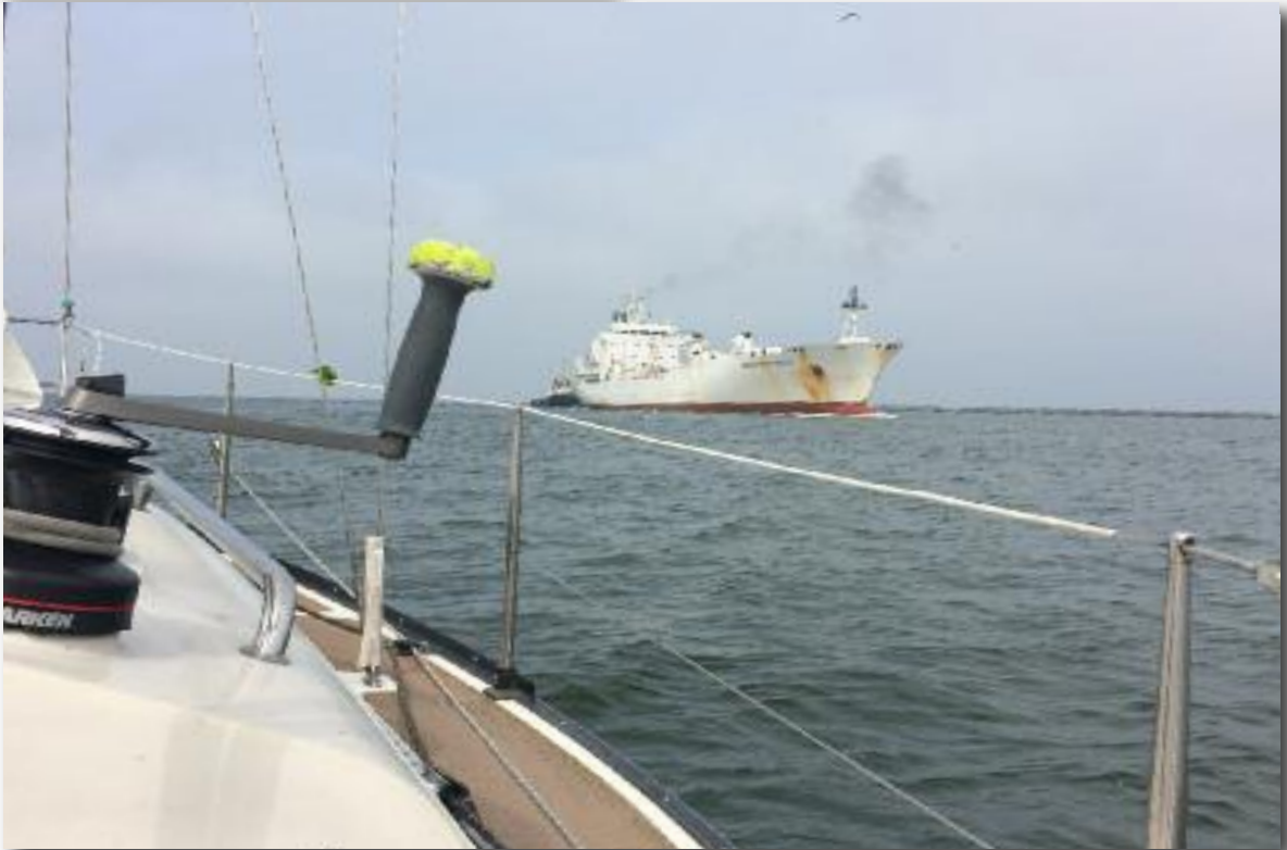
De R&ZV Naarden onderweg naar the UK..