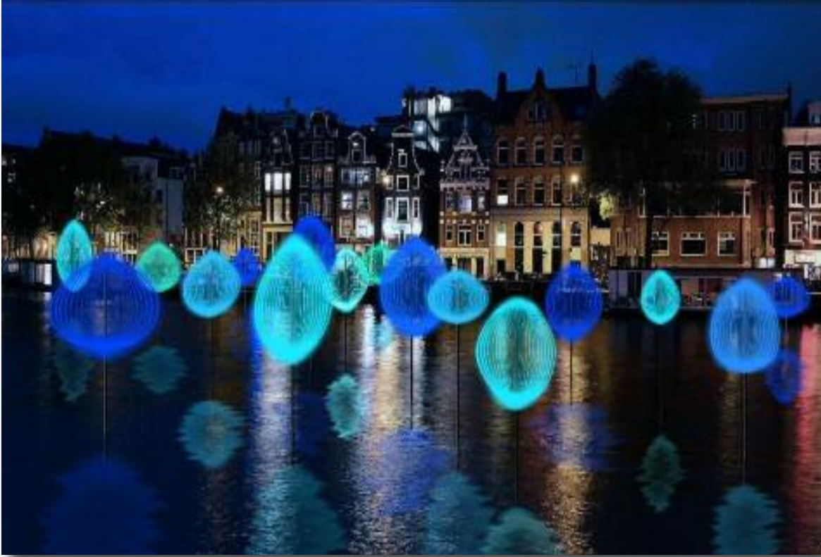
Adembenemende kleurenspeel op het water.

mogelijk om met een ervaren stuur het Light Festival te roeien. Zodra de inschrijving geopend