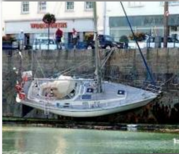
Is hier dan getij?