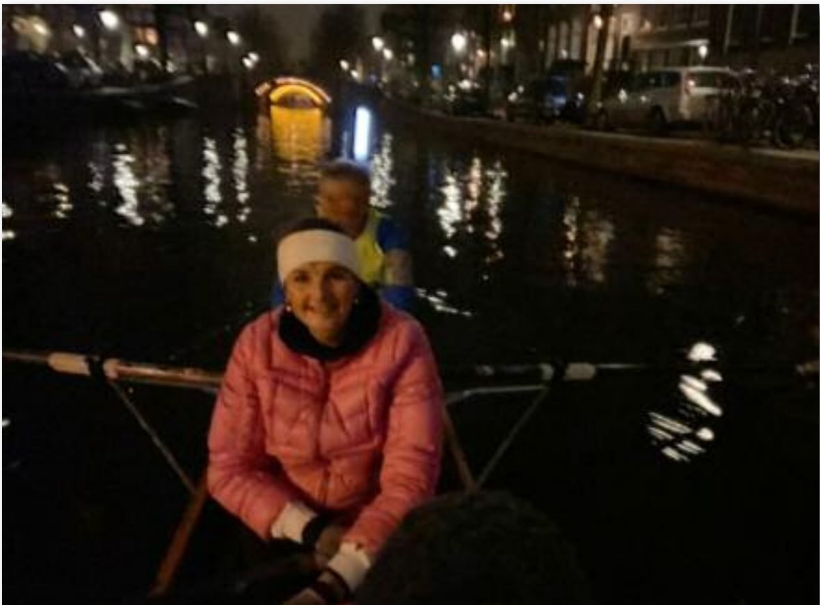
Coastal Rowing maar dan door de grachten..