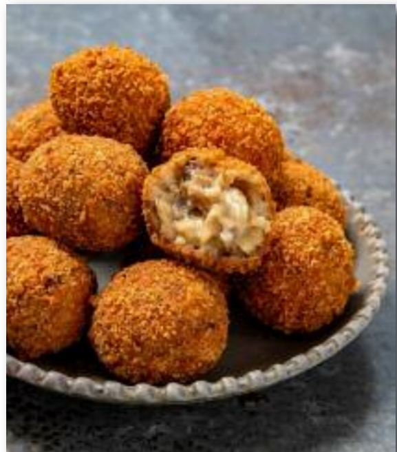
De bruine fruitschaal.

waterschade en het werd geda-teerd. Er werd budget vrijgemaakt