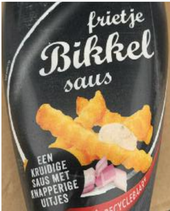
Na een Frostbite wedstrijd een patatje Bikkel, omdat je het verdiend hebt.

van 3 starts waarbij de derde start een kleine wedstrijd was. Alles werd gefilmd en besproken na afloop in het clubhuis. Er stond heel weinig wind. En als ik zeg heel weinig, bedoel ik ook heel weinig. Kortom bij de WAC zouden we de 60 niet gehaald hebben, maar die J/80's weten toch bij zo weinig wind nog van de lijn te komen. Druk in het zeil is minimaal en voor een nieuwkomer als ik erg lastig te voelen. Conclusie: ik moet nog veel oefenen :-). Gelukkig kan ik Zondag 19 maart meedoen met de laatste Frostbite Cup. Hopelijk flink wat wind, zodat ik ook een beetje in de Groove kom en niet overboord gegooid wordt.