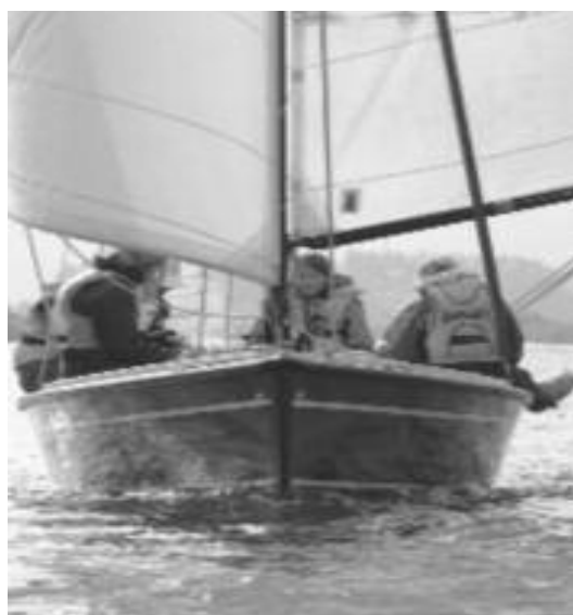
Voor de wind

lunch (met natuurlijk voor de kids kroketjes) voor ons klaar. 's Middags ging de hele meute weer het water op om een ijsje in Grou te eten. Rond 17.00 uur kwam iedereen weer terug, even de spullen opruimen, en toen was er tijd voor een welverdiende borrel met natuurlijk een haring erbij.