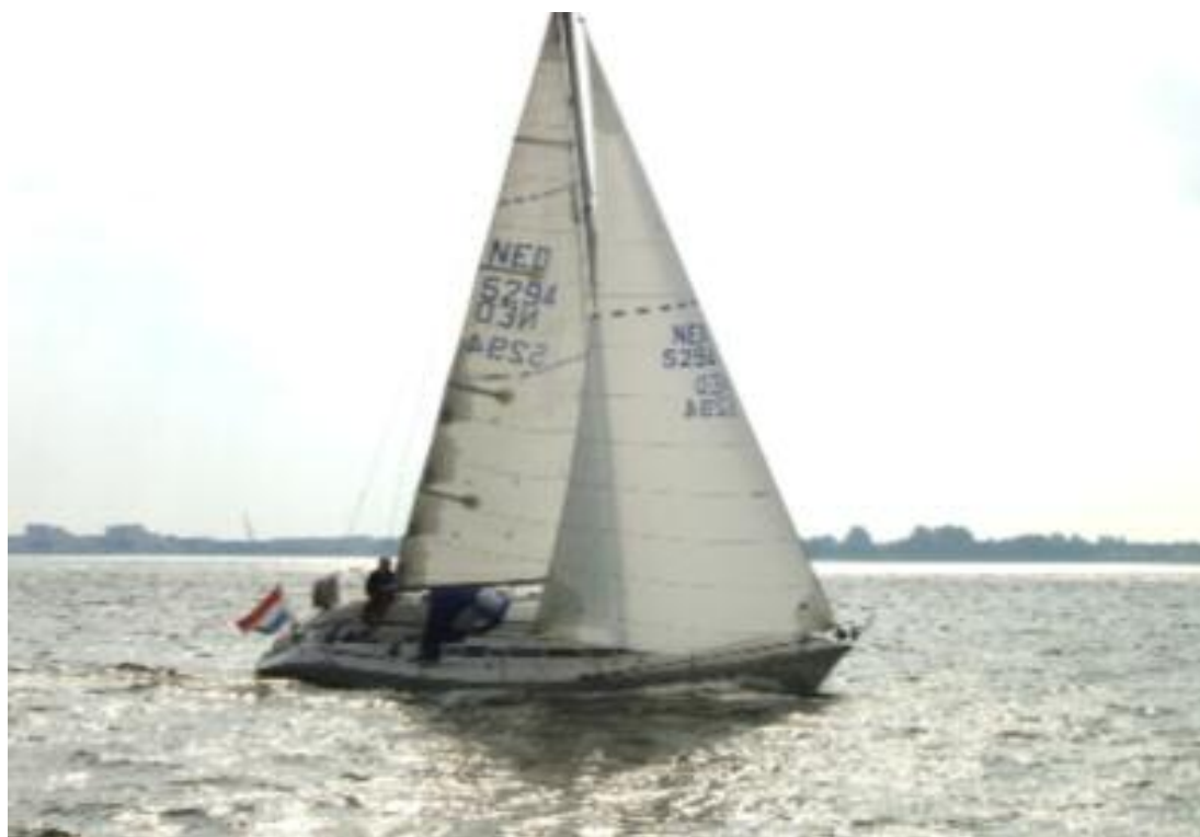
Roxanne bijna in de winter

Kijk voor informatie over de winterwedstrijden op de website www.flevomare.nl en schrijf je in!