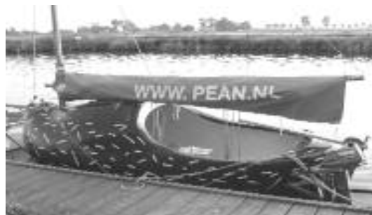
Een klomp met een zeiltje

Kortom het ontbrak aan niets! Moe maar voldaan vertrok iedereen weer naar huis.