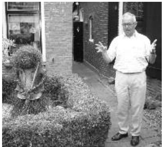
Rondleider met ervaring

Er was markt in het dorp en dus gezellig druk. Nadat de gehele 'Naardenvloot' had afgemeerd maakten we ons op voor een interessante rondleiding door Spakenburg met een ervaren VVV-gids.