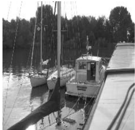
Langszij bij de Atlas

‘borrel’ zouden gaan organiseren in plaats van in het clubhuis. Iedereen was dus ruim op tijd en onderweg hadden we goed zicht op de zeilende deelnemers. Eenmaal aan boord van de Atlas was iedereen voldaan en rozig van zon & wind, want wat een heerlijk zeilweekend was het geweest.