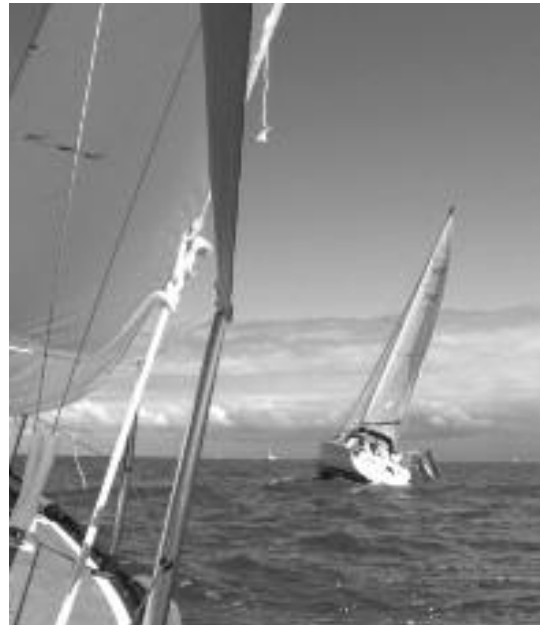
Windkracht 6 Bft

Het is al meteen gezellig zo 's morgens vroeg op het palaver. Na een pittige tocht zijn er