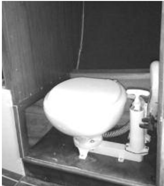
Van de pot ge.....

Op de steiger van Den Oever worden de vergane planken onder de pot vandaan gehaald. Een gemakkelijke klus.