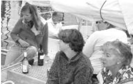
De dames aan de Borrel