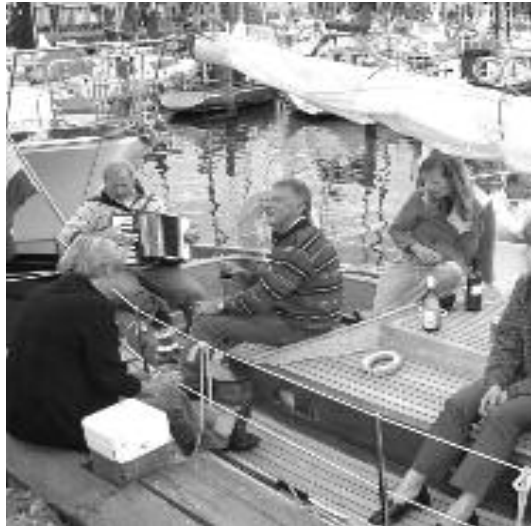
'Boord aan boordborrel'