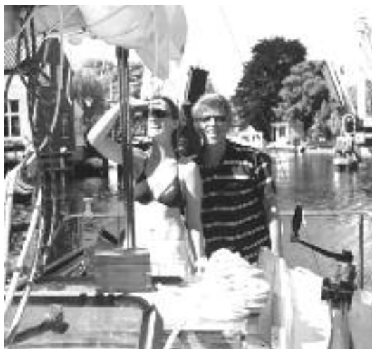
De Delivery ploeg heeft het druk

nodig om eerste te worden. Maar van achteren kijk je een koe in zijn....en het neemt vanuit ieder opzicht niet weg, dat dit van het gehele "Team Windrose" een "TOPPRESTATIE" is! Dat Bavaria tóch snelle boten bouwt, is hiermee gelijk maar weer eens bevestigd. De dag erna moest er naar huis gevaren worden, en onze tweede prijs(een kersenhouten kistje met een koperen kompas erin)werd op het dak geplakt, zodat een ieder maar kon zien dat hier een tevreden Bavaria zeiler rondvaart. Voor de Zondag was er een Deliveryploeg ingevlogen, deze dames hebben de zonovergoten terugreis naar de thuishaven Naarden beschreven. Deze is te lezen op www.dewindrose.nl .