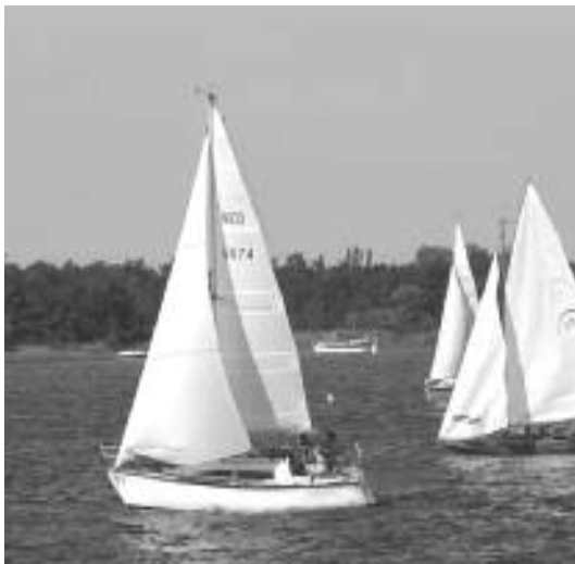
de Windrose op kop

Jeffrey de startklok omgehangen, en alleen gewacht op zijn orders.