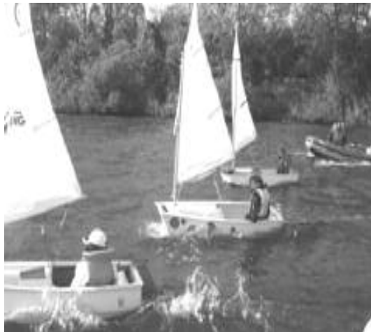
Jeugd onderweg naar het Gooimeer

De jeugdcommissie heeft op gronden van de continuïteit recent besloten om de contributie voor het seizoen 2006 vast te stellen op €55,- per deelnemer. Om onze activiteiten ook in de toekomst voort te zetten moeten wij ernstig rekening houden met toenemende kosten voor onderhoud van het materiaal en eventuele vervanging van rubberboten/motoren etc. waarvoor wij reserveringen dienen te maken.