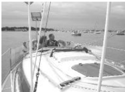
De Frya op zout water

Als u denkt, dat lijkt mij ook een mooi en uitdagend perspectief, zet dan de informatieavond van de zeezeilafdeling op woensdagavond 15 maart en de Tocht navigatie zee voorlichtingsavond op 29 maart alvast in uw agenda.