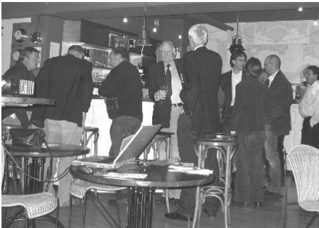
Drukke aan de Bar

Bij hen kun je ook informatie krijgen over wat het precies betekent om mee te doen. Het is leuk werk, je ontmoet veel leden van de R&ZV 'Naarden' tijdens de activiteiten binnen onze vereniging.