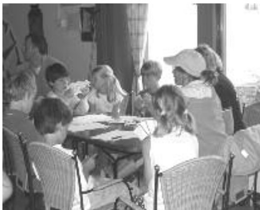
In "Het Behouden Huys"

Op 23 april hebben we de theorie-middag. Alle belangrijke dingen die je moet weten, vóórdat je het water op gaat, worden dan verteld. Verder laten we nog wat watersportvideo's zien, en organiseren we de cursus "O.O.O", Optimist Optuigen voor Ouders. Want zeker als je nog jong bent, zullen je ouders je een handje moeten helpen met je bootje.