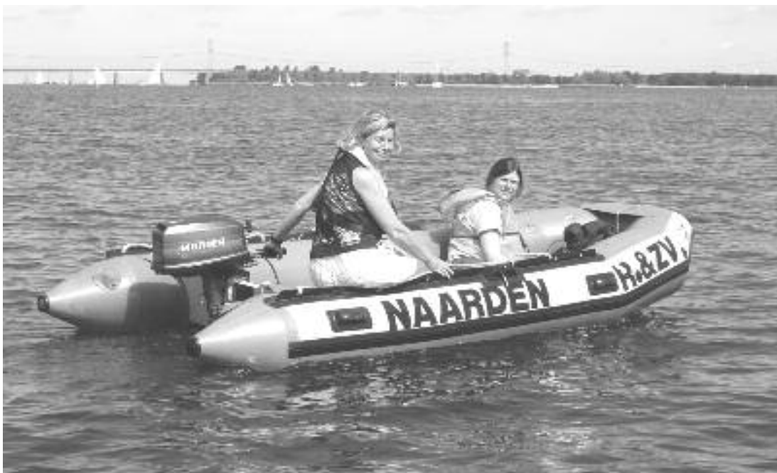
De begeleidende rubberboot

Daar gaan we in praktijk oefenen hoe het is, om met al je zeilkleren en zwemvest te zwemmen, wat je moet doen als je boot omslaat, want dat kan natuurlijk een keer gebeuren. Als je weet hoe dat voelt, en hoe je je boot weer recht krijgt en weer verder kan zeilen is er niets aan de hand. Om dit te oefenen is het zwembad met een lekkere watertemperatuur een beter begin dan het koude water van het Gooimeer.