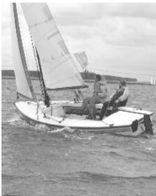
De kampioen van 2005

Er zal een afvalserie gevaren worden om tot een winnaar te komen. Twee teams varen een “best-of-three” tegen elkaar, degene die 2 wedstrijden wint, wint de match en gaat door naar de volgende ronde. Een wedstrijd duurt ongeveer 10-15 minuten, een totale match dus maximaal een uur. Een loting