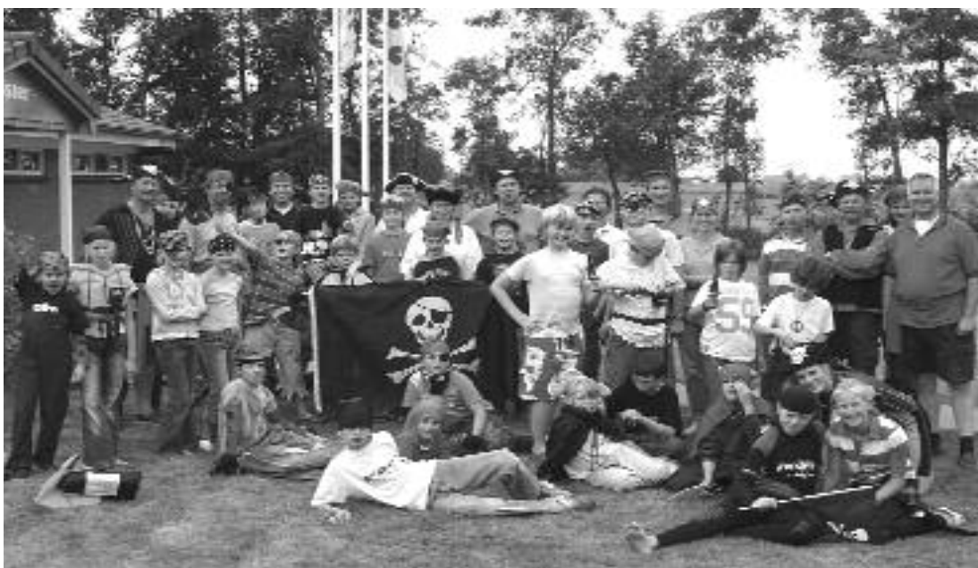
Alle Piraten met begeleiding bij elkaar

Zondagochtend, half acht ontbijt. Wat een bleke koppies! Lunchpakketjes mee en een mooie tocht gevaren met Valken: in elke boot een groepje kinderen, de oudsten zonder begeleiding. Dit was heel anders varen dan de dag ervoor; nu hadden velen de handen vrij om er andere dingen mee te doen dan sturen en de schoot bedienen. Daar kun je aardig nat van worden... Weer terug bij Pean wachtten droge kleren, en ouders om de piraten weer af te voeren. Wat een geslaagd weekend.