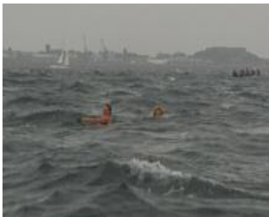
“Sea moderate to rough...”

Begin september zijn we begeleid door twee trouwe supporters naar St. Malo gereden en vandaar met de snelle Catamaran via Jersey naar Guernsey. Ons roeikwartier hebben we opgeslagen in St. Peter Port in het familiehotel Captain Cook. Dit Britse familiehotel moet model gestaan hebben voor Fawlty Towers. Een wat ouder brits echtpaar fluisterde elkaar toe “don’t mention the war” toen ze onze Germaanse koppen zagen. De eerste dag was gereserveerd voor verkenning van het roeiwater voor Guernsey. Vooral de ligging van de boeien is belangrijk. Als echte slootroeiers hadden we geen GPS bij ons. De dag werd afgesloten met een Vin d’Honneur. Britten kunnen entertainen.