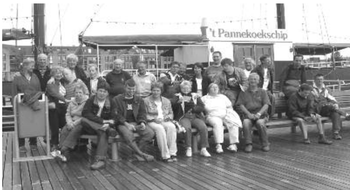
Alle deelnemers en vrijwilligers op de kiek

maximum dat een van de gasten aankon. Voor gasten, schippers en bemanningen was het weer een heerlijke en vrolijke dag. Allen, ook de Rotaryclub Naarden-Bussum, bedankt voor hun bijdrage. We haalden dit jaar zelfs de pers. Een foto stond in de