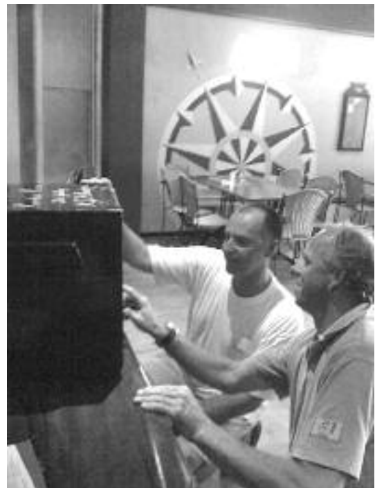
Waar komt mijn plaatje op de Hooikist?