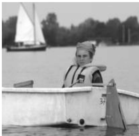
Een Optimistische piraat

maar 's middags veldslag: in de Optimisten voeren de blauwe piraten tegen de rode piraten Levend Stratego. Dat was een groot succes. De kinderen snapten goed waar het om ging (wat op zich al een prestatie is, prima uitgelegd door Gerard) en hadden de grootste lol als er iemand op de Bom of ander onheil bleek te stuiten. Een vlot was de gevangenis, ideaal. De strijd werd beslist in het voordeel van de blauwe piraten: 2-1 .