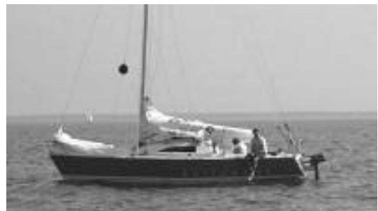
De Hollewaai voor anker

Dit is voor mij woensdagavond zeilen. Er wordt niet met het