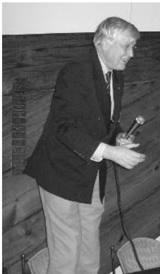
De voorzitter met zijn Nieujaarstoespraak

mogen aan kinderen onder de 16 geen alcoholische dranken worden geschonken. Wij doen dat ook niet, maar men kan soms een andere indruk krijgen. Voor de tweede keer was er dit jaar na afloop van de nieuwjaarsreceptie een gezamenlijk diner in het havenrestaurant, Brasserie Gooimeer, waaraan