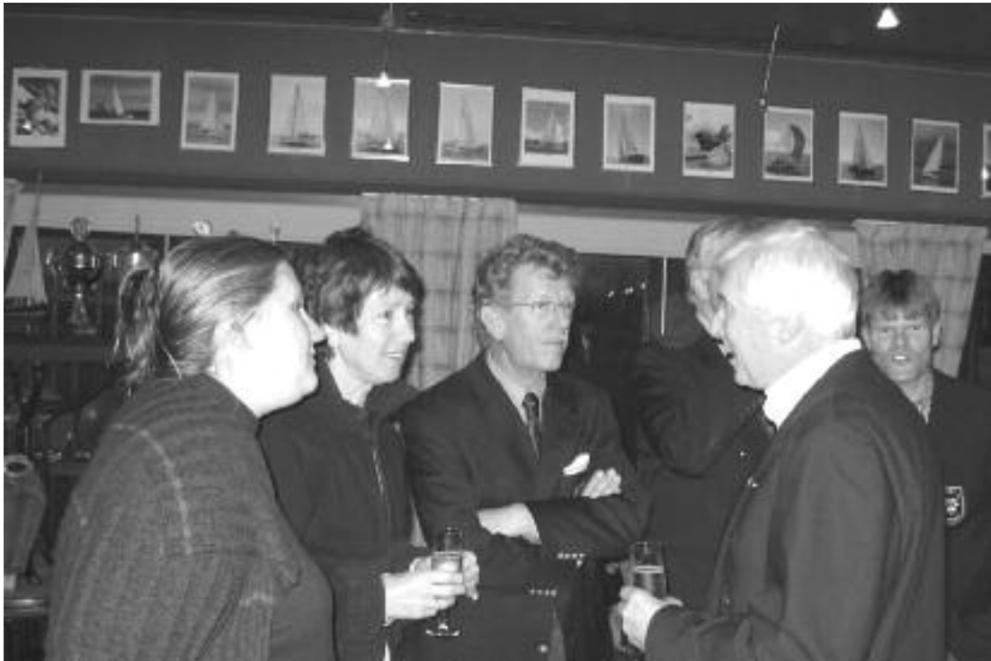
Het bestuur in vol ornaat

Klinkt natuurlijk raar en ongeleefd voor diegenen die bijna iedere aanwezige “kennen” maar als je voor het eerst in je leven een nieuwjaarsreceptie bijwoont als “vers” lid van de R&ZV Naarden is het niet gemakkelijk. Het is immers ook vervelend als je dént dat je