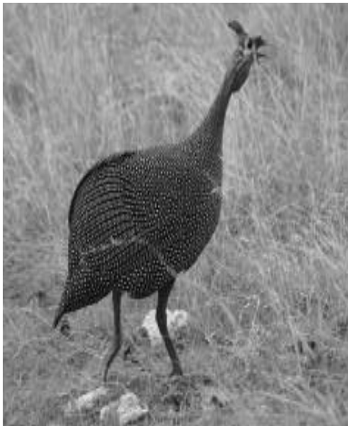
Namens deze Parelhoeder, bedankt Bert

Speeches werden afgestoken op een manier van stokje doorgeven in een estafette..... Sander nam de eerste ronde het woord en doordat een ander zich aangesproken voelde werd er gereageerd door een volgende aanwezige die Sander dan weer probeerde de loef af te steken. Er werd bijvoorbeeld aangehaald dat er iemand van de aanwezigen een hele zware boegschroefmotor had, waarop die persoon terug kwam met een anekdote over de reden daarvan.