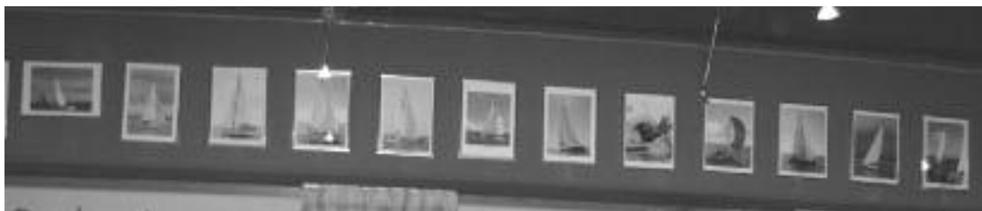
Gepimpte clubhuis, met eregalerij der boten

Een vereniging als de onze kan niet zonder vrijwilligers. Het is in feite allemaal vrijwilligerswerk wat er gedaan wordt. En het is een hele hoop wat er allemaal geregeld en gecommuniceerd moet worden om de vereniging in haar verschillende geledingen draaiende te houden. De vereniging heeft gelukkig nog steeds weer mensen onder haar leden die bereid zijn al dat werk te verzetten.