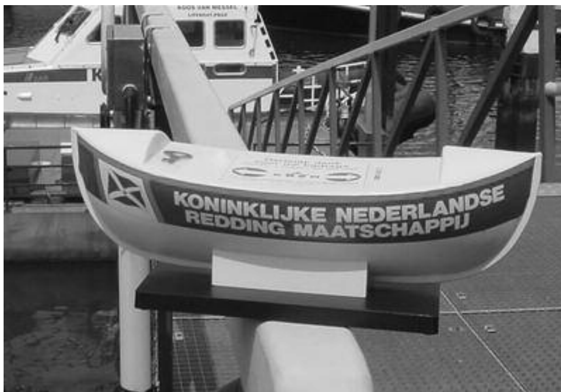
Bunkerbootje waar de opbrengst van, naar de KNRM toe gaat