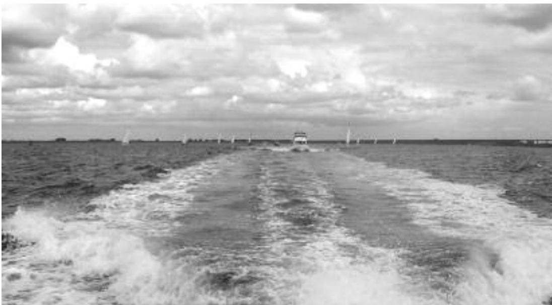
Grand Banks op snelheid

besluiten om niet uit te varen, een alleszins verstandige beslissing van die bemanning, want halverwege de oversteek krijgen we toch een stevige bui waar extra wind (34 Kn.) onderuitkomt en kennelijk heeft een van de schepen die bui aan een touwtje want hij blijft met ons optrekken richting Belgische kust. De zee springt aan, de golfhoogtes nemen flinke vormen aan. De grotere schepen kunnen op zo'n golf aardig surfen, de kleinere schepen ver-