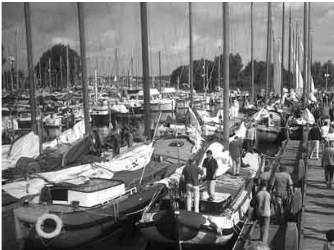
Skûtsjesilen in Huizen 2008, wordt weer gezellig druk.

Rond 17.00 uur worden alle 25 skûtsjes weer terugverwacht in de jachthaven 't Huizerhoofd, onder begeleiding een dweilorkest. Wat ook dit jaar weer voor een indrukwekkend gezicht zal zorgen.