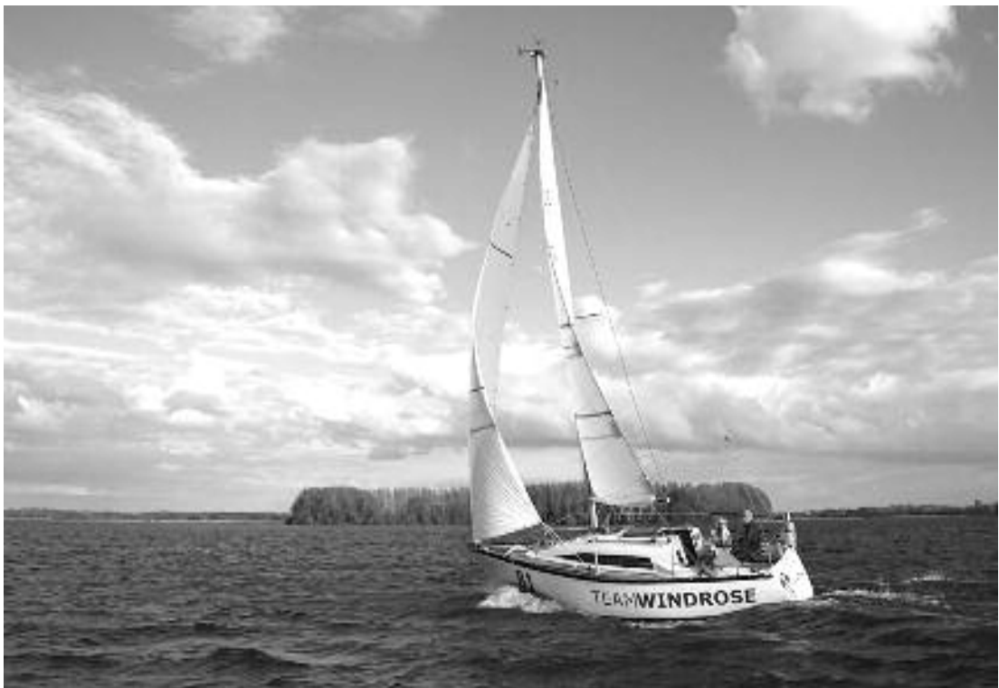
Een van de allermooiste schepen van de R&ZVNaarden, Team Windrose

wel dat die blikseminslag niet echt in de Windrose was geweest maar er dicht naast, dat het niet op die bewuste avond was gebeurd maar een aantal dagen eerder, en dat het SMS-je alleen maar op een dramatisch lijkend moment uit